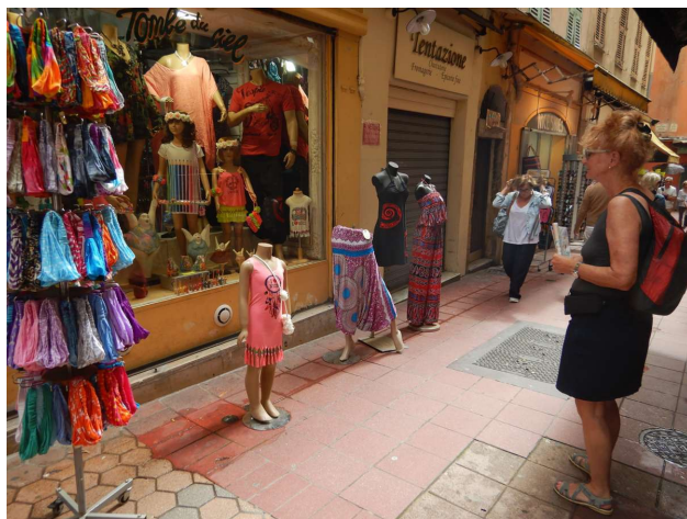
Nice er en rigtig ferieby med souvenir forretninger, kludeforretninger og restauranter

Turen fra Nice til Antibes var heller ikke særlig strabadserende, kun 11 sømil i svag vind, så maskinen fik lov at arbejde. Kom fra Nice klokken tyve minutter over ni og var fremme i Antibes klokken kvart over elleve. En begivenhedsløs tur, hvor der var underholdning undervejs: Dels sejlede vi forbi lufthavnen, hvor der var rigeligt at se på, og dels så vi så tre brand-slukningsfly, der øvede sig i at samle vand op og kaste det ud igen (heldigvis ikke på os). Ved indsejlingen kaldte vi på kanal 9, og det skete der ikke noget ved. Nå, vi lagde os ind ved indtjekningskajen. De havde ikke hørt noget om vores reservation. Det viste sig så, at vi havde lagt os ind ved den kaj, hvor superyachts'ne skulle melde sig.