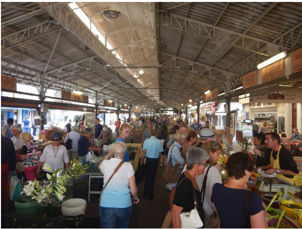
Dejligt marked i Antibes