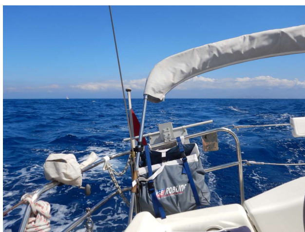
Fin tur mod Cote d'Azur

.... hvor vi igen fik et par timer for sejl. Klokken lidt i fire, måtte vi starte motoren igen og fik ikke sejl op mere den nat. Det er to dage