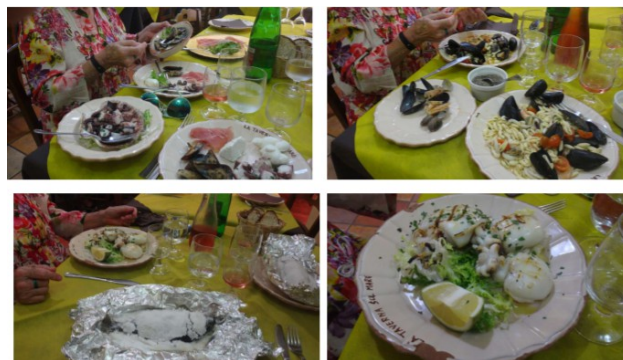
Et beskedent italiensk måltid

fyldt diesel på dunkene og fyldt vand på her og havde strøm i land for første gang i meget lang tid. Selv om regnen havde skyllet dækket grundigt, vaskede vi dækket