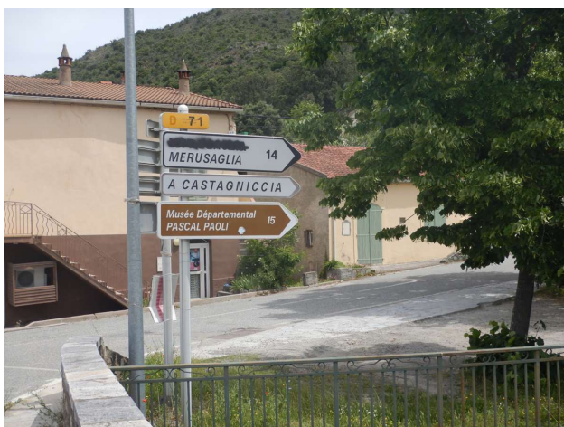
Nationalismen lever stadig her på Korsika.