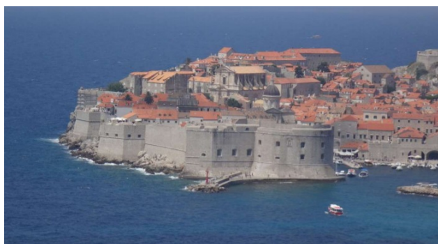
Dubrovnik er en rigtig fin by (men med mange turister)