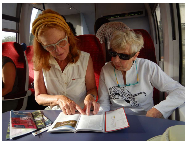
På tur med Chemin de Fer Corses