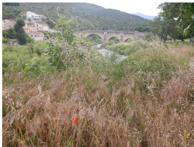
Toget kører igennem fantastiske landskaber

Da der kun er et tog morgen og et tog eftermiddag begge veje, måtte vi satse på en lang og afslappet frokost U Ponte Á a Leccia. Indrømmet U Ponte Á a Leccia er ikke verdens centrum, der er ikke rigtig gang i den der.