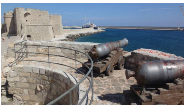
Monopoli har det hele (undtagen mange lystsejlere)

Endelig: Fernet Branca på sengekanten, det er Italien! Herefter går tur i byen med bl.a. besøg på befæstningstårnet. Super is på et lille gelateria Equador chokolade og Pistaccio, det kunne man godt blive afhængig af. Herefter en overdådig frokost med bl.a. en gang blandede antipasta (jeg holdt op med at tælle hvor mange forskellige der var, men der var rigeligt. Morfar.