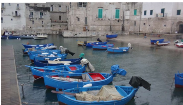
Inderhavnen i Mopoli med byporten i baggrunden

juli 2015 28 / 49 salame fra i går... med rødvin: en super dejlig lokal Primitivo!