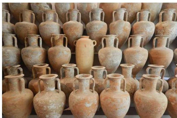
Det arkæologiske museum i Lipari har en enorm samling