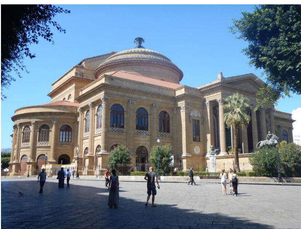
Teatro Massimo, Palermos opera

I dag var vi så til isfestival. Der er hundredvis af små isboder der hver udleverer en type is. Man køber så billet til et vist antal prøvesmagninger og så går man i gang. Fik smagt fire forskellige is, og den mest spændende var nok den med chokolade og anis. Fire smagsprøver var nok til os, men byen var tæt fyldt med mennesker.