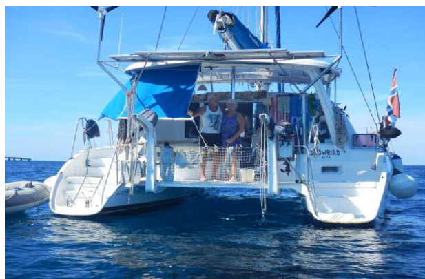
Vi var i løbende kontakt med Snowbird of Norway som også var på vej østpå

Sov meget bedre i nat, vinden lagde sig i løbet af natten, så vi holdt op med at hugge i fortøjningerne. Formiddagen gik med at købe ind til dagene ude på øerne og fylde vand på. Cyklerne blev pakket ned, så nu skal vi bare have solsejlet og skyggeteltet ned i aften, når det er blevet mørkt. Vi havde været lidt i tvivl om vi havde forkortet sejlspindene nok, så vi tjekkede det lige igen, og så fandt vi ud af at vi ikke kunne få sejlspindene til at sidde fast inde i lommen. Der manglede simpelthen burrebændel inde i lommen. Fabrikationsfejl? øv øv!