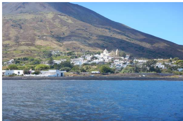
Ved Strombolis fod ligger den hvide by ved den sorte strand

Egentlig havde vi nok tænkt os, at vi skulle en tur op på vulkanen. Det skal ske med en guide og det foregik fra klokken ti om formiddagen, midt i dagens hede og så et par timer frem; - eller fra klokken fem, hvilket vi heller ikke var vilde med, for så ville det meste af turen foregå i nattens mulm og mørke,- så vi afstod fra den oplevelse, men nød udsynet til den vulkanen og de fiskebåde, der blev trukket op på den sorte strand om natten.