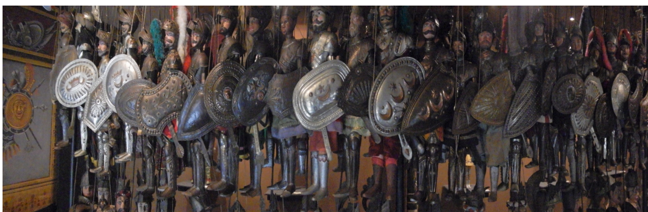
Fra dukketeatermuseet i Palermo (figurerne er en halv meter høje)