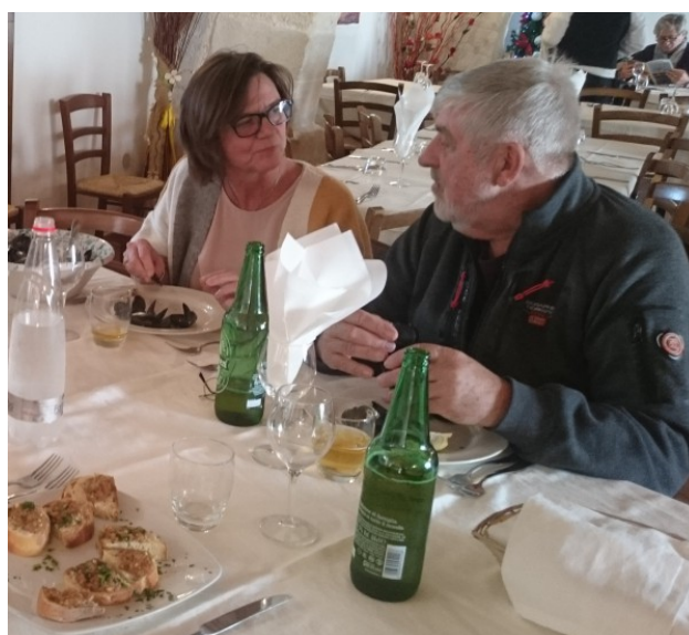
God frokost i dejlige omgivelser på saltmuseet syd for Trapani