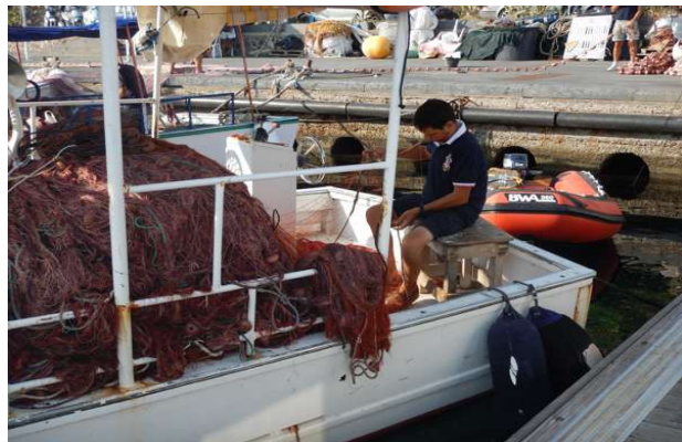
Lipari, i Marina Pignataro er der også en del fiskeri

begyndte at pille ved den, viste det sig at han kunne dreje ringen med flapperne uden at den inderste ring fulgte med!... gad vide om det er det der har været årsagen til at motoren i flere sæsoner ikke har ville trække kølevand igennem? Det bliver spændende at se.