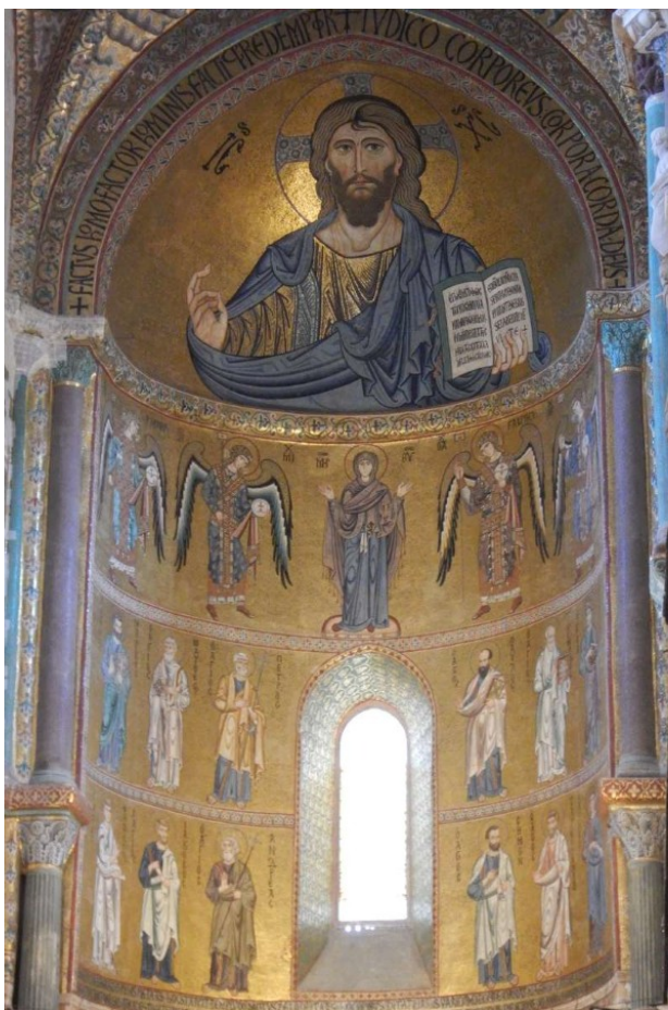
Cefalu: Mosaikken over alteret i den normanske Kkatedral er fantastisk!