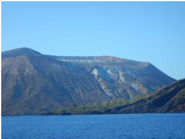
På vej til Vulkano, en keglevulkan

der skulle hjælpe os med at lægge til ved flydebroen. Men det gik op for mig, at vi skulle ligge svinebundet i fortøjningerne. Først på med de to udlagte hækfortøjninger, så fuld damp på maskinen, så stramme helt op i forfortøjningerne, av av! Det tydede ikke godt for natten.