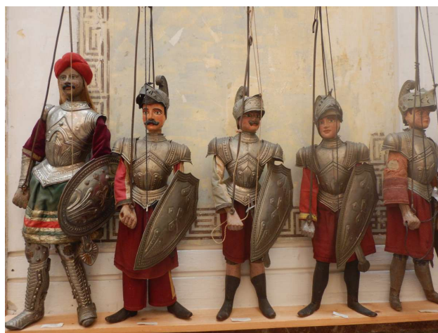
Typiske dukker i de Sicilianske dukketeatre