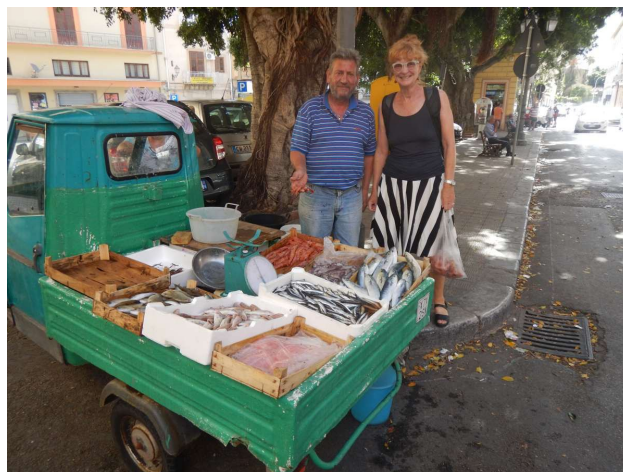
Vores fiskehandler i Termini Imerese