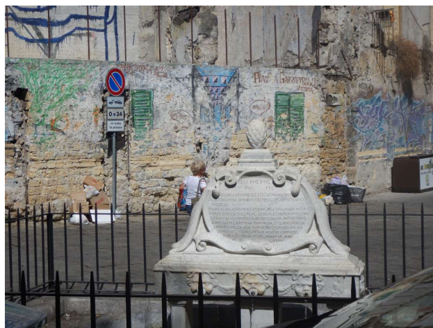
Spændende hjørner og pladser overalt i Palermo

engelsk så vi får rigtig praktiseret vores franske, hvilket sikkert er en god ide nu hvor vi er på vej hjemover (gennem franske kanaler). Frokost spiste vi i dag oppe i byen. Vi havde været ude for at se lidt på Palermo en søndag formiddag, var stødt ind i flere bryllupper og fik endvidere set det internationale dukke museum (Palermo er kendt for sit teater med marionetdukker, noget vi endnu har til gode).