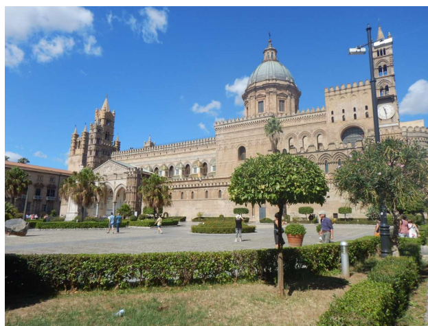
Catedralen i Palermo

Egentlig var det bare meningen at vi skulle op til TIM forretningen og have opdateret vores internetkonto (vi har ind til videre bevaret en lokal dataforbindelse for at sikre datasikkerheden og her i Italien får vi 30GB for €10 så der kan også streames TV). Da det var gjort fandt vi ud af at vi nok måtte se nærmere på det Palads som Normannerne byggede her i 1100 tallet og som angiveligt skulle være en af de største seværdigheder her i byen.