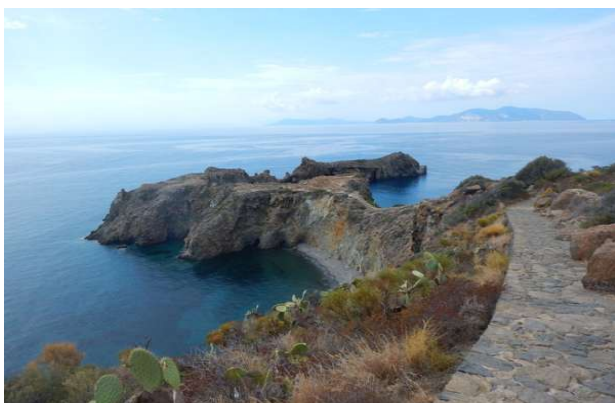
Bronzealderlandsbyen ligger utrolig flot på en klippe godt beskyttet til alle sider.

Tilbage ved molen, fik vi os en øl og spurgte den unge mand der serverede (sommerferiejob) om der slet ikke var ældre bygninger på øen. Han pegede i den modsatte retning en vi havde været i, så det blev så morgendagens projekt. Onsdag gik turen så sydpå og vi så da et område hvor de stadig færre fastboende holder til. Der skulle angiveligt være en resterne af en landsby fra bronzealdereren (12-14.000 fvt. og den mykenske periode, hvor bl.a Odysseus besejlede dette område) længere sydpå, og da vi så skilte, traf vi en heroisk beslutning, købte vi noget vand og satte kursen mod ruinerne. Det var faktisk en fin tur derud, og landsbyen ligger utrolig flot på en klippe godt beskyttet til alle sider. Da vi kom tilbage til molen var vi klar til frokost og øl. Derefter siesta på båden. Da vi kom ud på båden, så det ud til at vi ville få en meget urolig nat, der var ikke meget læ her og vi rullede en del.