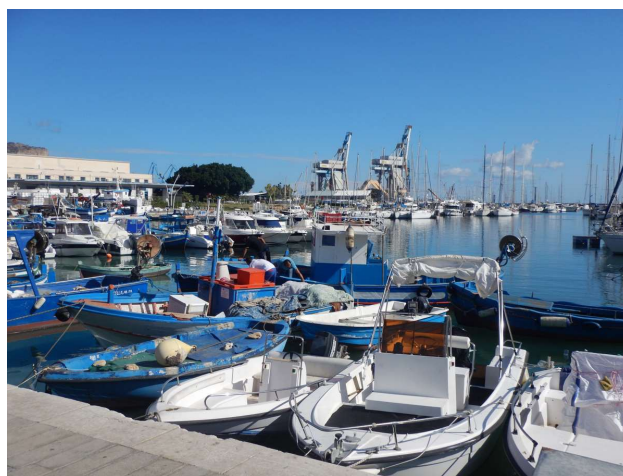
Palermo: La Cala, en blanding af professionelle fiskere, lystfiskere og lystsejlere

Er man til kirker kan man få meget tid til at gå her. Så blandt andet domkirken, som også er en af de kirker, der har historie tilbage til normannerne, hvor arkitekturen også har mauriske (islam) elementer. Historien fortæller i øvrigt at den normanniske tid på Sicilien var en tid med udpræget religiøs tolerance, spændende nok. I en anden kirke, San Domenico, så vi en reminder om en mere dyster del af Palermos historie, nemlig stedet hvor den dommer, der har gjort mere end nogen anden for at bekæmpe mafiaen: Giovanni Falcone er begravet. Efter flere mislykkede mordforsøg kom han 'endelig' af dage ved en bilbombe i 1992.