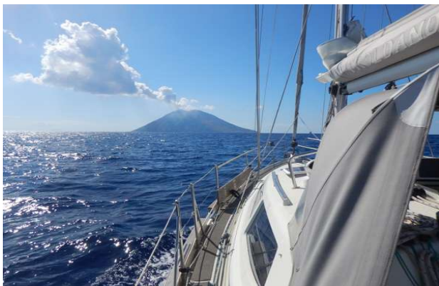
Målet med efterårsrejserne er De Lipariske Øer. Her på vej mod Stromboli

Vibo Valentia til Palermo, via de Lipardiske Øer