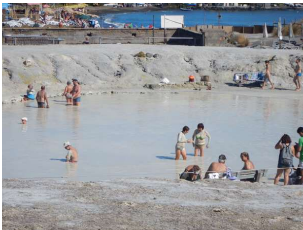
Svovl-mudderbad på Vulkano