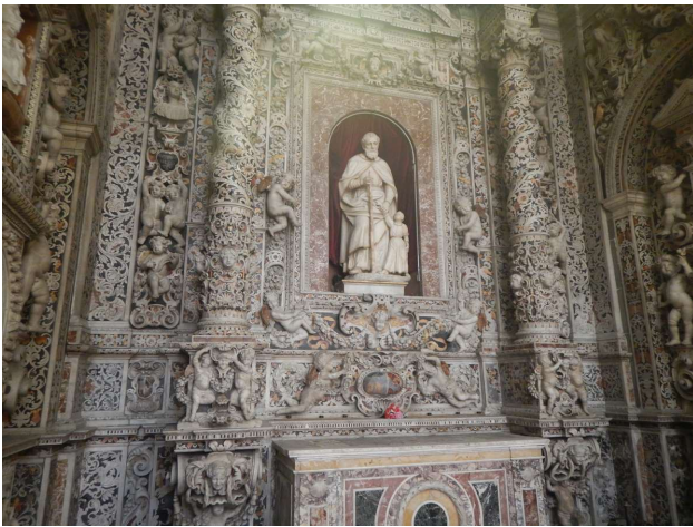
Jesuskirken, en Barokkirke, så det vil noget