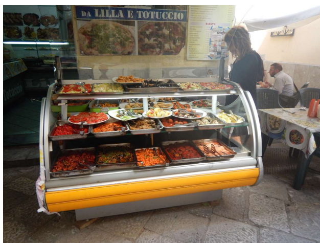
Gadekøken med antitasti ser vi overalt i byen

Det altoverskyggende projekt i de forløbne dage har været dækket! Vores ret ny-pålagte Gisa-TeX er begyndt at slippe (bare efter 2 år, øv). Det vi har lagt det på med Tech-7 holder ikke! Vi har gået rundt om problemet, som katten om den varme grød, for det er noget rigtig møg, hvis det ikke kan holde, for hvad så? Lige nu er vi nået til at vi vil prøve at reparere det, og så må vi se