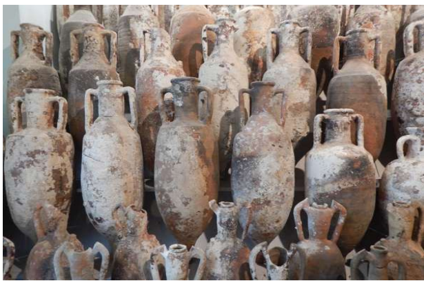
Samlingen er rigtig stor... og der er også andet end krukker!